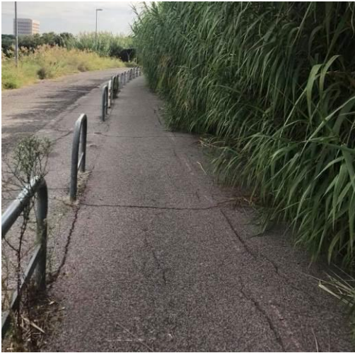
Magliana: le canne hanno invaso metà carreggiata