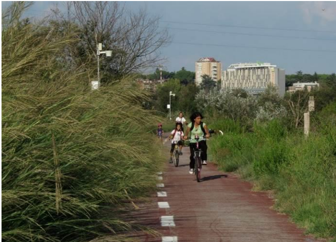
Dimezzamento della corsia a Tordivalle