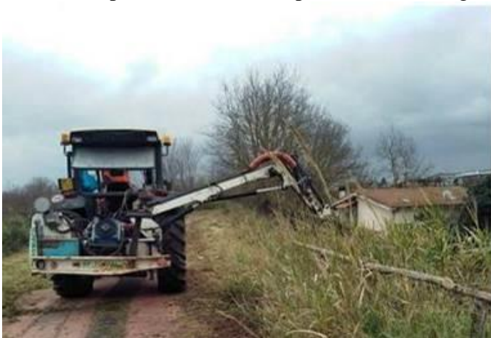
Saxa Rubra, gennaio 2018

Anche se gli sconfinamenti sono a macchia di leopardo, l'intervento di sfalcio non può essere pensato in maniera spot, perché la crescita della vegetazione riguarda l'intero sviluppo dei due tratti suddetti, quindi richiede un piano di sfalcio completo, sulla falsariga di quanto effettuato a gennaio 2018.