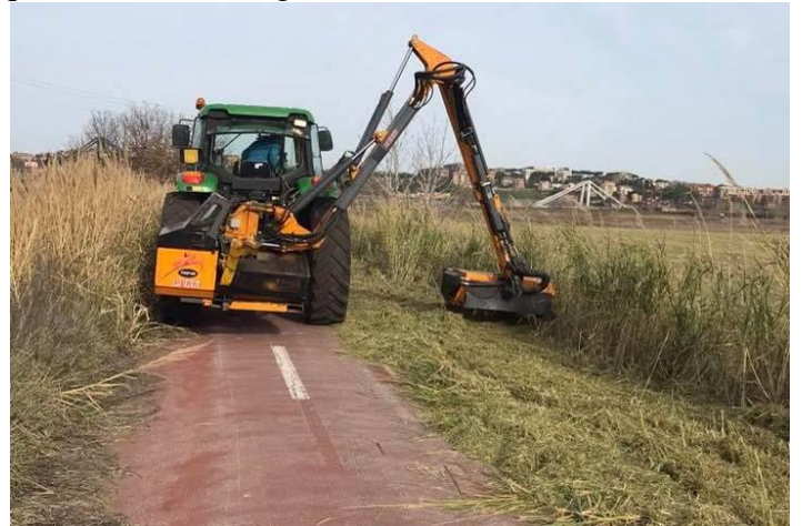
Tordivalle, gennaio 2018