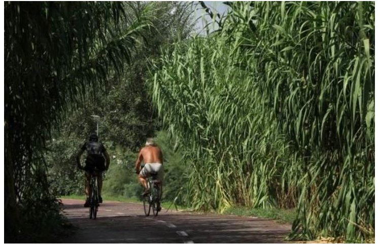
Canneto a Saxa Rubra

Anche se gli sconfinamenti sono a macchia di leopardo, l'intervento di sfalcio non può essere pensato in maniera spot, perché la crescita della vegetazione riguarda l'intero sviluppo dei due tratti suddetti, quindi richiede un piano di sfalcio completo, sulla falsariga di quanto effettuato a gennaio 2018.