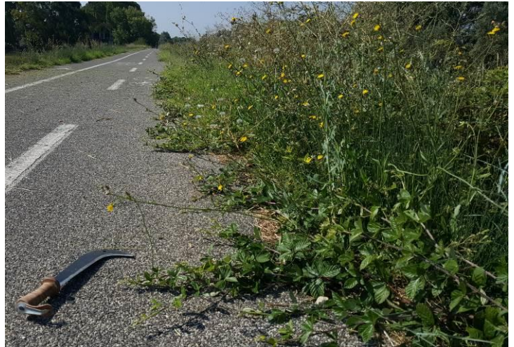
Rovi spinosi a Tordivalle